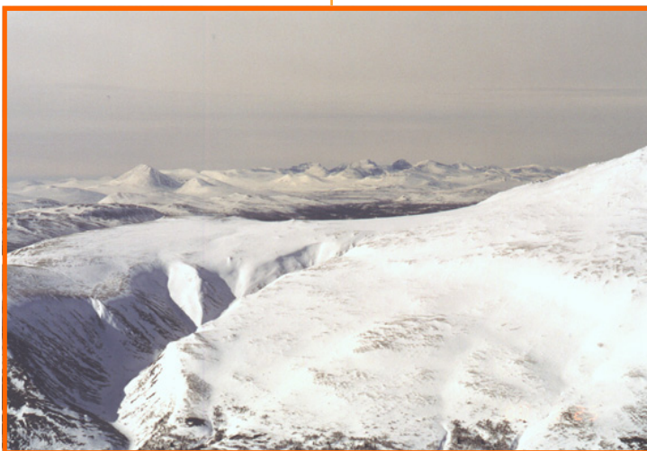
Flat-Tron sett fra nord-øst, med Grøtåa i forgrunnen og Rondane med Alvdals-Sølen i bakgrunnen. Flyfoto: BP. Pilot: S. Ellingvåg.

Stiftelsen ønsker å foreta nærmere grunnundersøkelser på Flat-Tron til sommeren, og i den forbindelse vil det bli søkt om samtykke fra Sameiet på Tron.