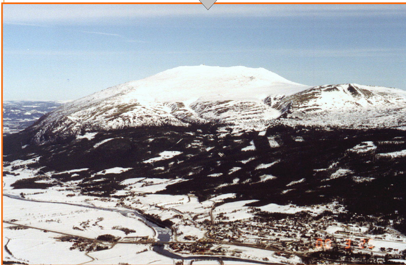
Tronfjell sett fra sør-vest, med Alvdal sentrum, Glåma, Steibrua og Aukrustsenteret i forgrunnen, lørdag den 25.03.00.

Med fugleperspektiv inn i det nye årtusen!