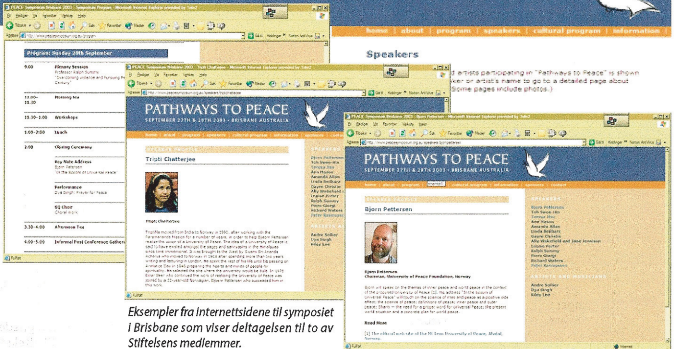
Eksempler fra Internettsidene til symposiet i Brisbane som viser deltagelsen til to av Stiftelsens medlemmer.