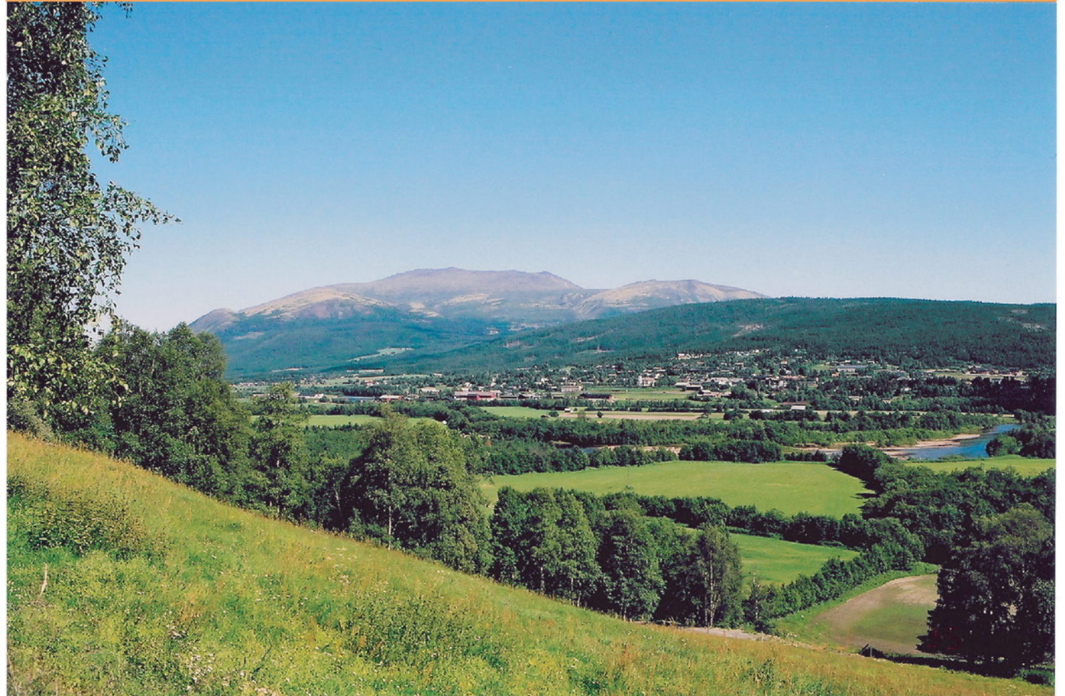
Tronfjell sett mot NØ, med deler av Alvdal sentrum og "Øya" hvor Glåma og Folla møtes, i forgrunnen. Bildet er tatt fra Vestate en av de usedvanlig klare sommerdagene i 2003.

September 2003 • Stiftelsen Tronfjell Fredsuniversitet • Nr. 3 Årg. 6