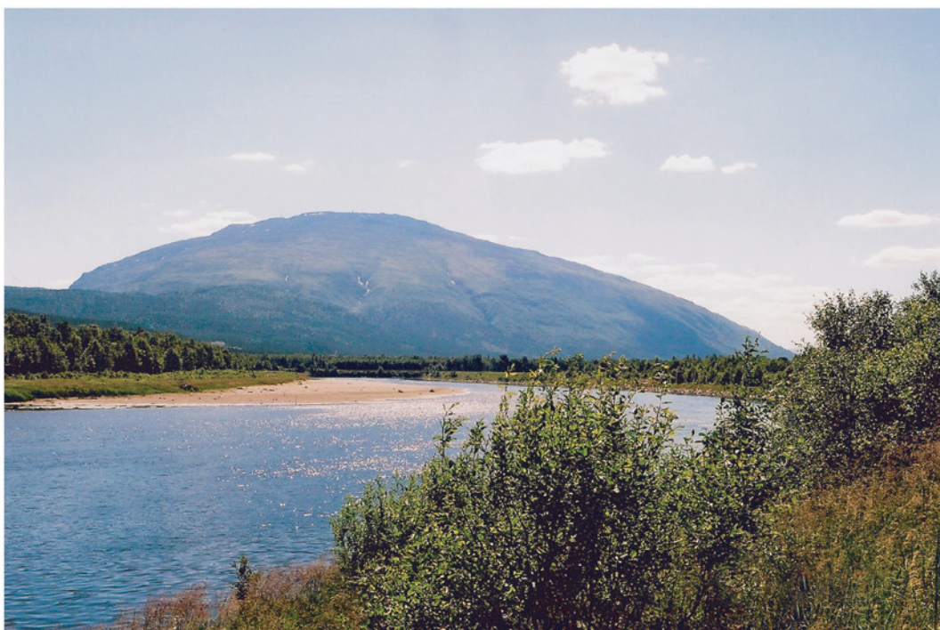
Tronfjell sett fra Fåset, Tynset kommune, i NØ, med Glåma i forgrunnen, en varm sommerdag i 2003.