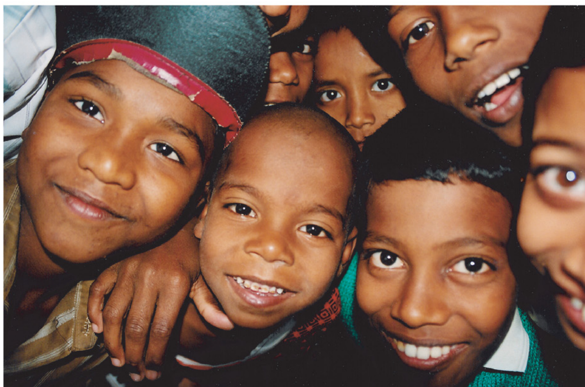
Glade foreldreløse gutter i Paramananda Mission! desember 1999.

Støtteforeningen for Paramananda Missions barnehjem i India (SPM) , med postadresse Terrassen 30, 8515 Narvik , er en viktig støttespiller i den daglige driften av barnehjemmet i Paramananda Mission, som er avhengig av kontinuerlige pengeinnsamlinger og gaver for sin eksistens. Året 2003 var det fjerde driftsåret for foreningen, og antall faste bidragsytere (faddere) var ved slutten av året 25 stykker. Fadderne betaler fra 75 til 500 kroner i måneden, og til sammen 66650 kroner ble mottatt i løpet av det fjerde driftsåret.