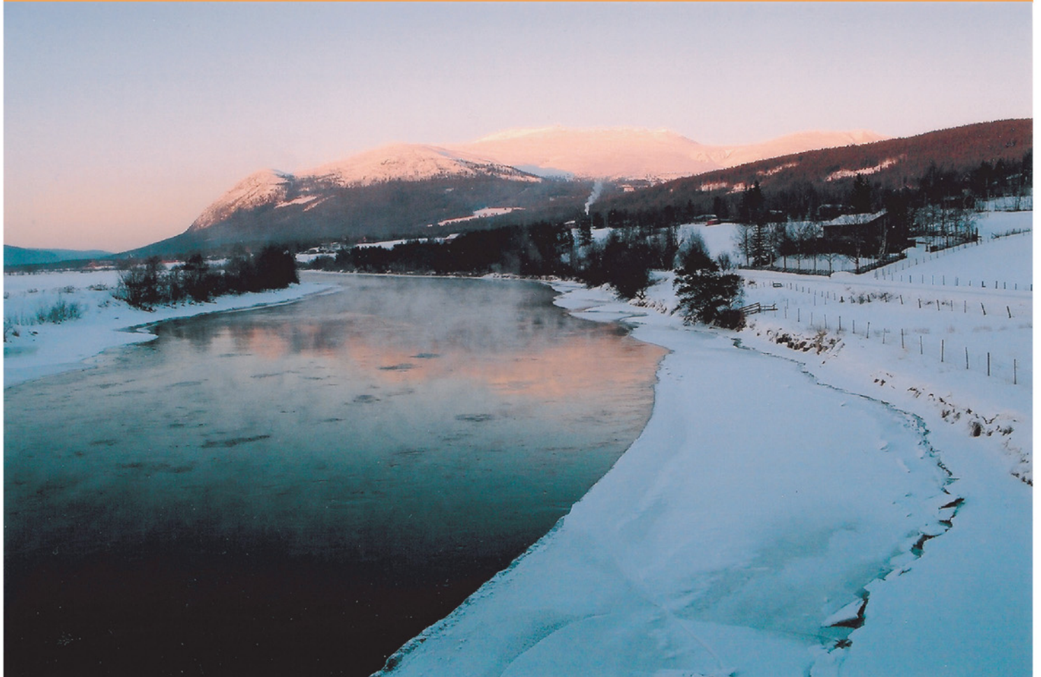
Tronfjell speiler seg i Glåma mens kveldssola reflekteres på den snødekte toppen, en kald kveld i slutten av februar 2005.

Mars 2005 • Stiftelsen Tronfjell Fredsuniversitet • Nr. 1 Årg. 8