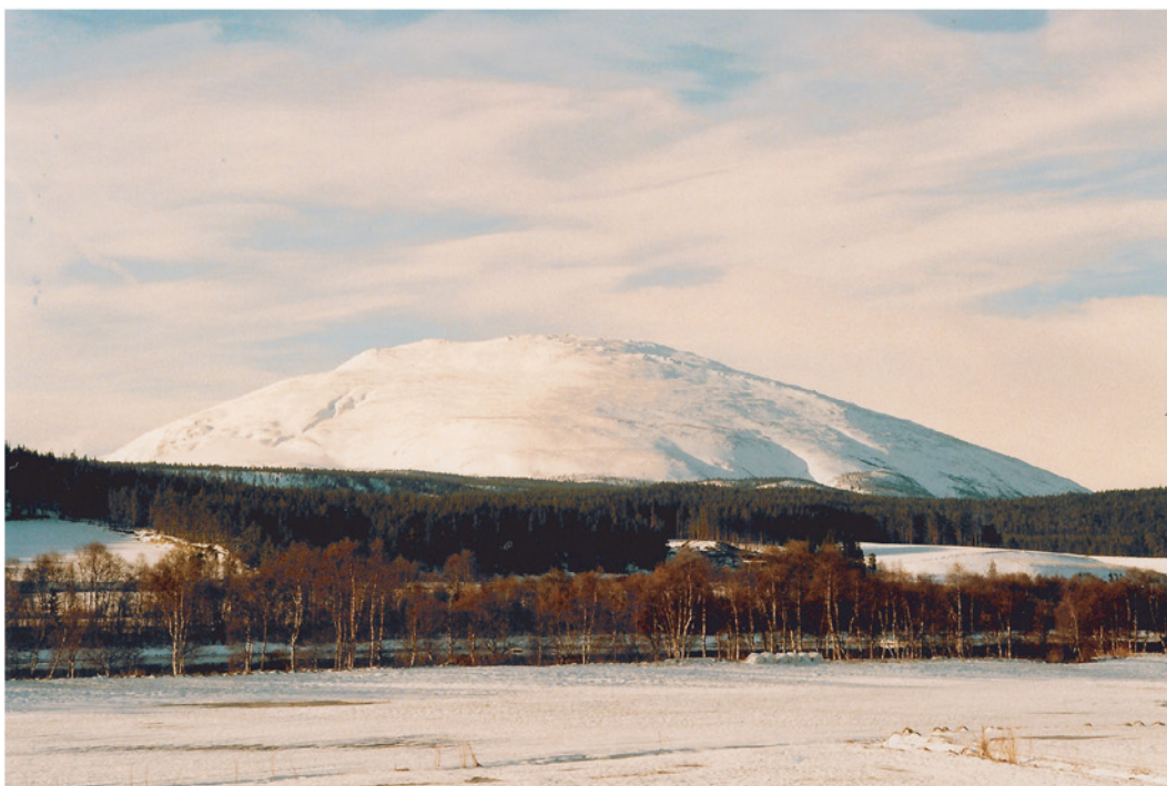
Tronfjell i morgensol, sett fra Telneset, Tynset kommune, mars 1999.