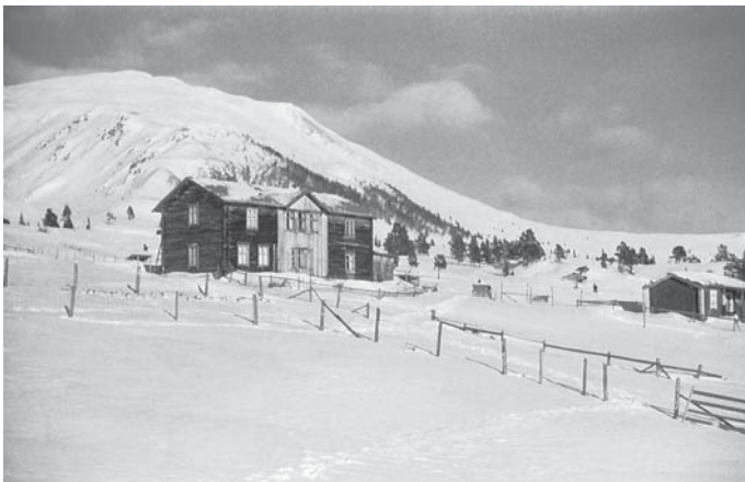
Gaurisankar Seter, desember 1945.