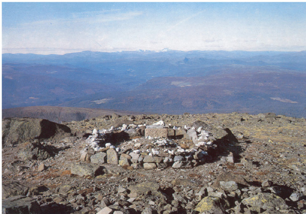
Graven til Sri Ananda på ca. 1400 meters høyde på Tronfjell. I horisonten ses Snøhetta, rett vest. Utenfor bildet i sør-vest er Rondane, og Savalen i nord-vest. Foto: Mittet (personlig oppdrag), 1975.