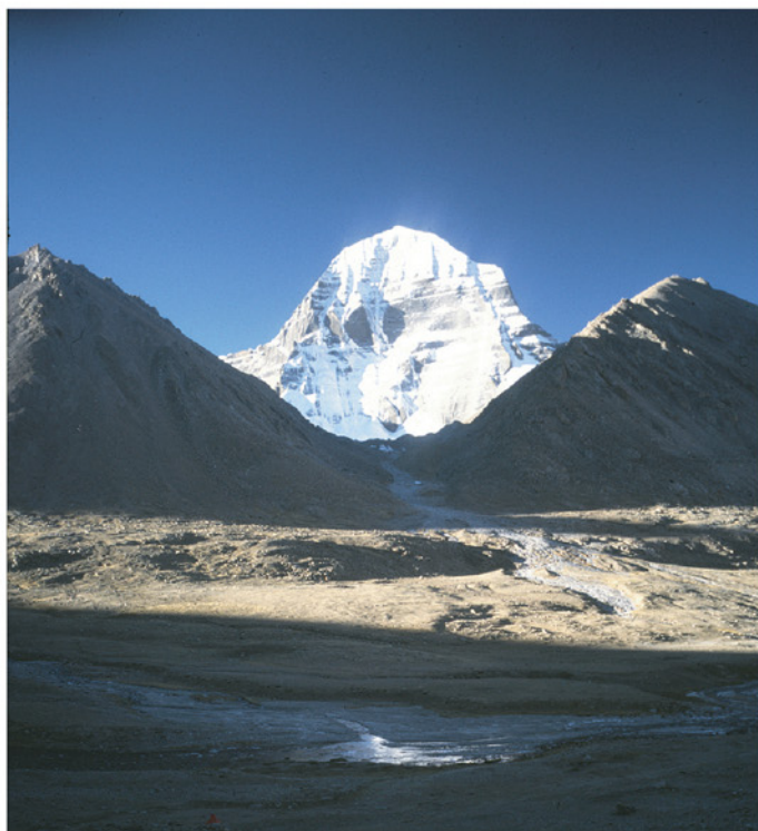
Mt. Kailash er fantastisk vakkert. Her nordsiden i soloppgang, en oktoberdag 18 år tidligere.

Med utgangspunkt i Lhasa brukte de fire dager med bil inn til Manasarowar hvor de lå i telt i tilsammen fire netter. En dag ble brukt til å reise rundt sjøen og en dag til å reise inn til foten av det frittstående og mektige Mt. Kailash, nord for sjøen. På tilbaketuren brukte de fem dager langs en noe annen vei enn på framturen. Tronfjellposten viser her noen av bildene fra turen, hvor alle på denne siden er fotografier, mens resten er videofilmklipp.