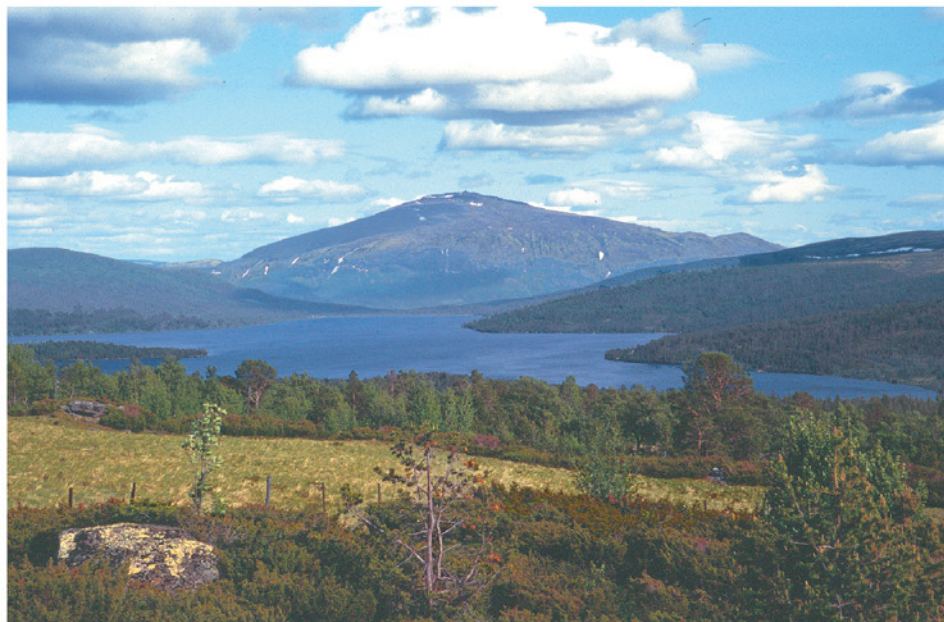
Tron sett fra Garvikåsen ved Savalen, sommeren 1995.