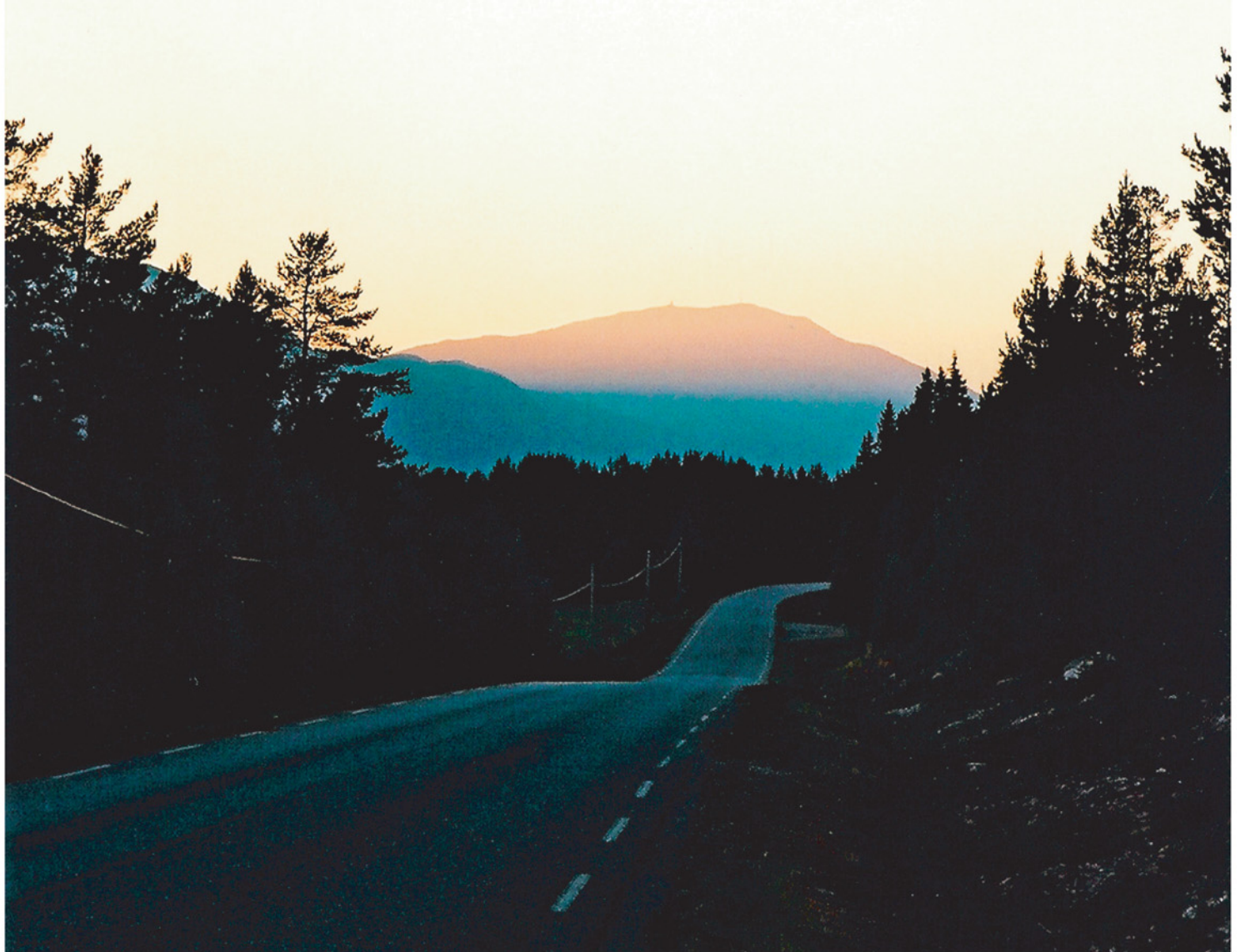
Dagens siste solstråler i Tyllidalen gyller på Tron, en flott augustkveld i 2004.

September 2005 • Stiftelsen Tronfjell Fredsuniversitet • Nr. 3 Årg. 8