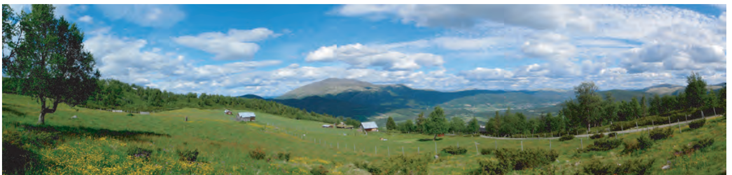
Tron sett fra Åsvangan i sør-vest, 5. juli 2010.

Det ligger i sakens natur at vi ikke kan "erfare" dette på den dynamiske bevissthetens premisser. Altså må vi "se" hinsides sinnets alle tre bevissthetstilstander etter at den fysiske kroppen er falt i dyp søvn. Dette er først mulig etter at alle ønsker, begjær, viljer og prosjekter som holder sinnet aktivt, er falt til ro gjennom vedvarende trening i selvoppofrelse og målrettet anstrengelse. Da vil sinnet etter hvert bli helt passivt (ikke aktivt og heller ikke inaktivt, men passivt), og uten sinnets spaltende effekt, "opplever" vi den Enhetlige, Totale og Absolutte Bevisstheten slik den er i Seg Selv - den nakne Sannhet - som Evig, Udødelig og Ren Væren, som ligger til grunn for alt liv.