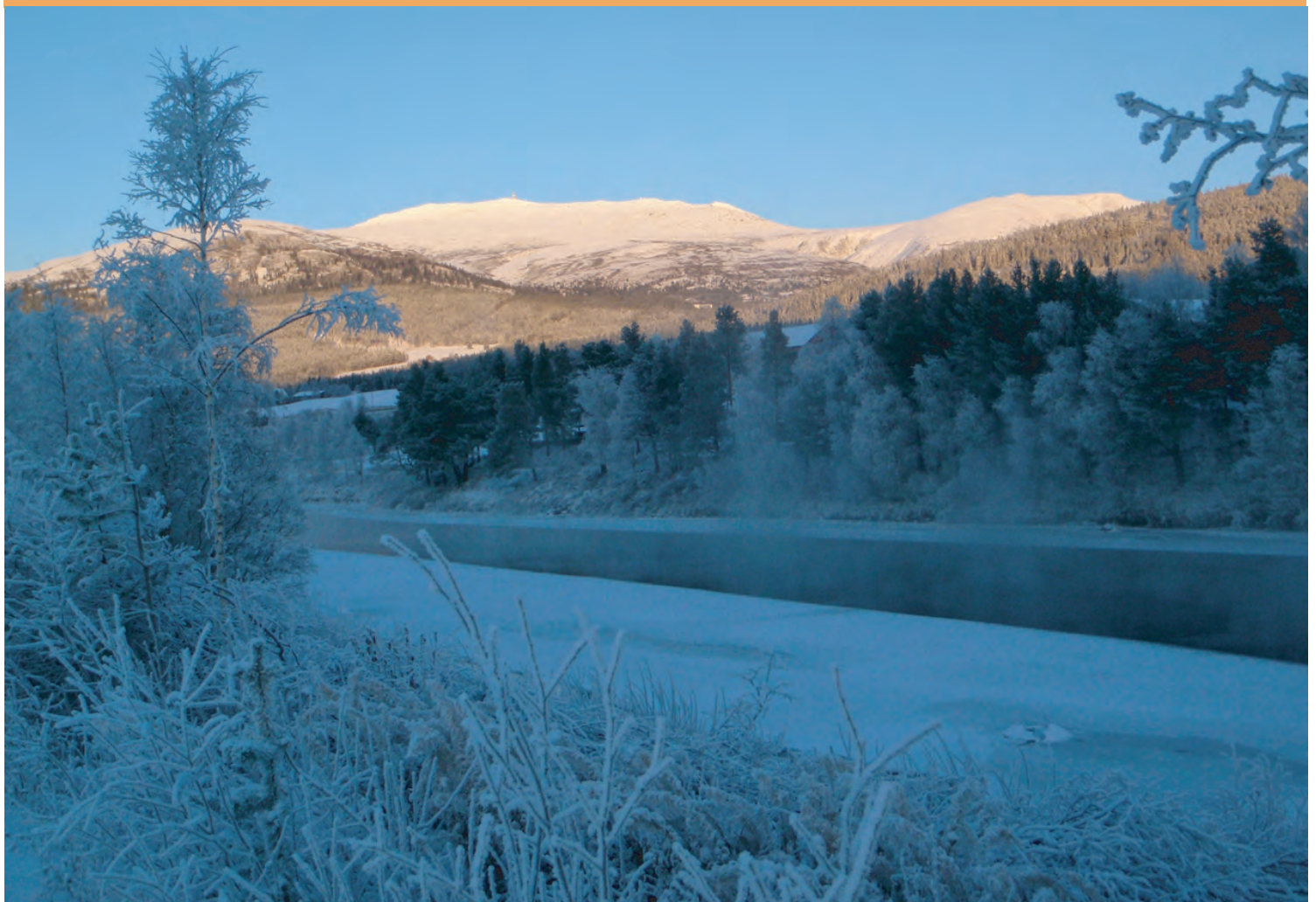
Tronfjell med Glåma i forgrunnen, sett fra Steimosletta kl. 14.06, den 30.november 2010, i 27 minusgrader.

Desember 2010 • Stiftelsen Tronfjell Fredsuniversitet • Nr. 3 Årg. 13