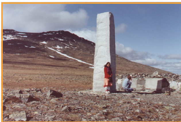
Monumentet på Tronfjell (Flat-Tron), som er første sten til Fredsuniversitetet. Foto: BP juni 1993.