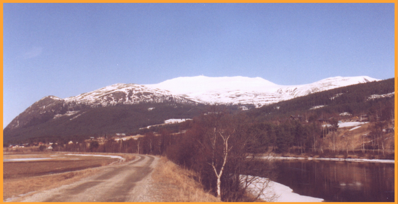
Tronfjell i påsken -98, med Glåma i forgrunnen, sett fra Aukrustsenteret.