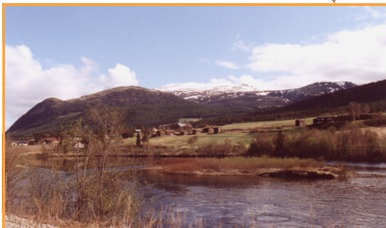
Tronfjell med Glåma og Husantunet i forgrunnen, mai-98.

Luftfartsverket har nå fått klarsignal fra Alvdal kommune for å oppføre et bygg på ca. 200m 2 med et 20 m høyt betongtårn for radar på toppen av Tronfjell. Bygget skal oppføres i plass-støpt betong med utvendig