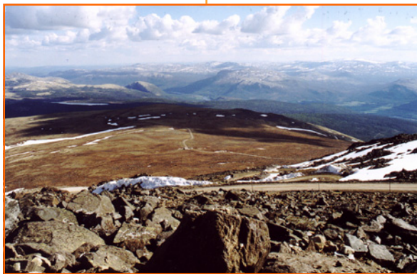
'Fredsplataet' (i solskinn) og Sørkletten (i skygge), sett fra Tron-toppen, primo juni -99.

Både Alvdal Senterparti og Alvdal Venstre går til valg i høst med programfestet støtte til Fredsuniversitetet kommende periode. Dette synes vi fortjener stor honnør og vitner om både vidsyn og framsyn hos disse partienes representanter!