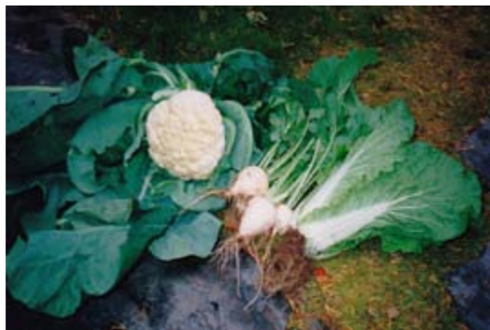
Over: TriptiMa tok initiativet til denne vågale dyrkingen, og resultatet ble storveis: Her er noen av de ferdige produktene; hodekål, blomkål, nepe og kinakål (!). Alt ble dyrket etter økologiske prinsipper uten kunstig gjødning eller sprøytemidler.