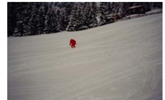
TriptiMa var ivrig til å stå på ski. Her i snøvær på Tronsvangen vinteren 1991.