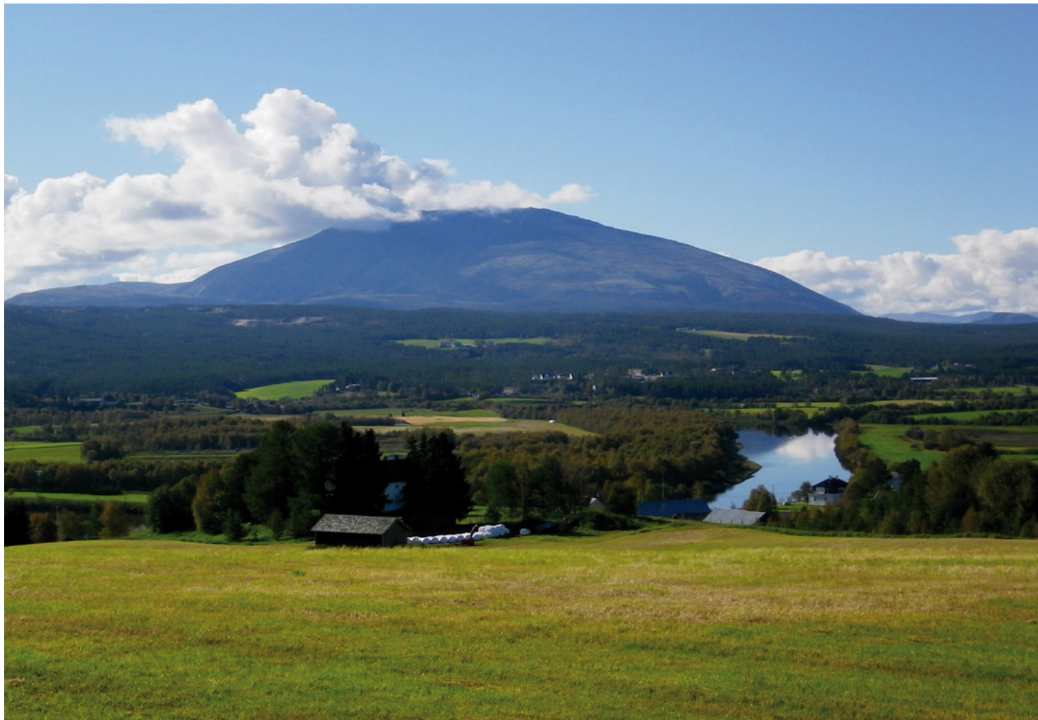
Forsidebildet av Tronfjell zoomet inn.

Reguleringsplanen ble ytterligere justert på enkelte detaljer etter forslag fra kommunens planavdeling, etter at den ble levert inn til Alvdal kommune 1. juli i år. Dette, sammen med en del uforutsett merarbeid i forkant av innleveringen, gjorde at planen ble vesentlig dyrere enn forutsatt og budsjettet for. All eventuell justering av planen etter at den politiske behandlingsprosessen er igangsatt, vil imidlertid bli fakturert kommunen, ifølge konsulenten. Etter 1. gangs behandlingen i formannskapet blir planen lagt ut til høring og offentlig ettersyn i seks uker før den behandles igjen neste gang.